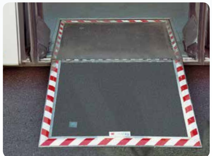
ausgeklappte Rampe (Beispiel)