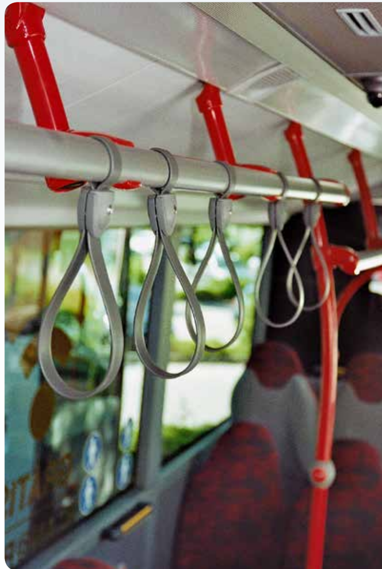
Haltestangen (Beispiel) Halteschlaufen (Beispiel)

Die Fahrzeuge verfügen über senkrechte und waagerechte Haltestangen (mit Halteschlaufen) im gesamten Bus (mit Ausnahme bei Low-Entry-Fahrzeugen nur zwischen Tür 1 und Tür 2), Haltegriffe an gangseitigen Sitzen (sofern keine Haltestange vorhanden ist) sowie eine rundlaufende Haltestange im Bereich der Sondernutzungsfläche. Haltewunschaster sind an den Haltestangen, an der Fahrerinnenrückseite und im Bereich des Stehperrons vorzusehen. Bei einer Viererbestuhlung mit gegenüber liegenden Doppelsitzen sind diese in Fahrzeuginnenrichtung auch an den Fensterseiten vorhanden.