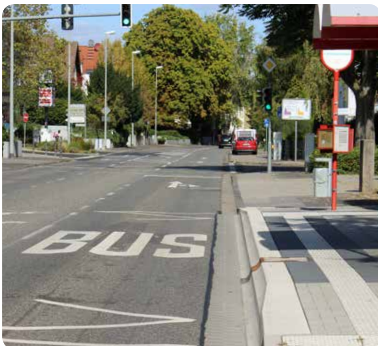
barrierefreie Haltestelle mit Kasseler Bord (Beispiel)