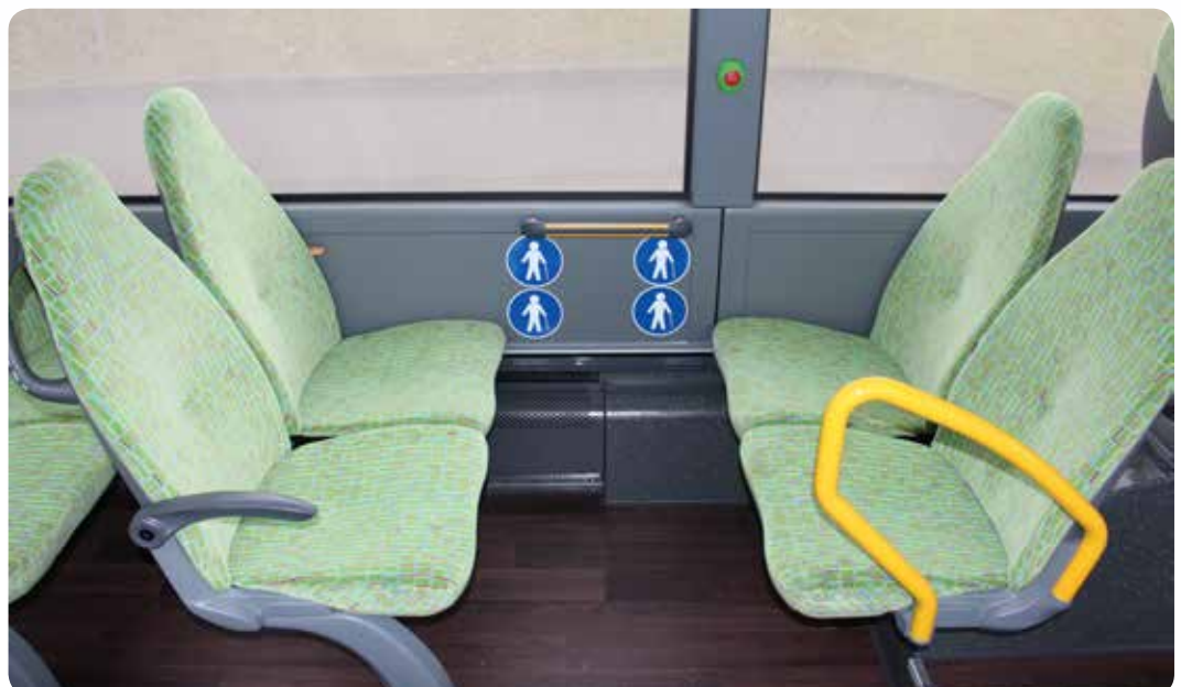
Sitzplätze ohne Podest für mobilitätseingeschränkte Fahrgäste (Beispiel)

Grundsätzlich sind die Vorgaben gemäß der EU-Richtlinie ECE-R 107 einzuhalten.