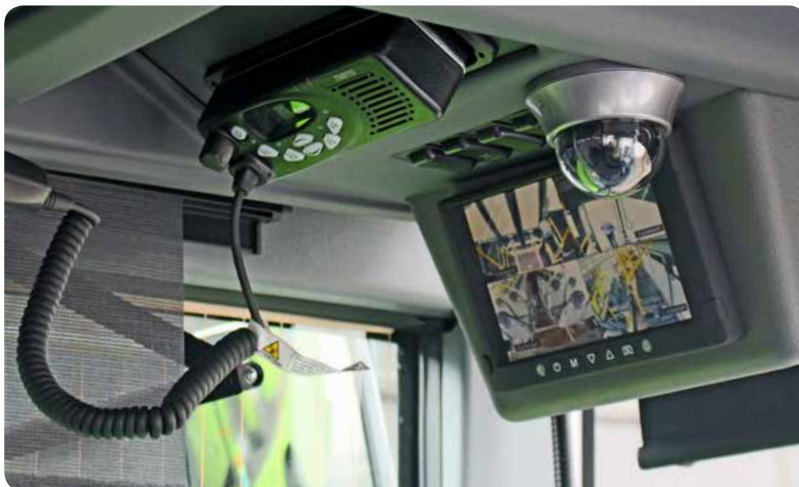
Kontrollmonitor im Fahrerbereich (Beispiel)