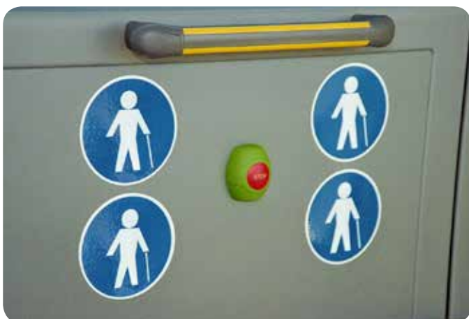
unterschiedliche Haltewunschtasten (Beispiele)