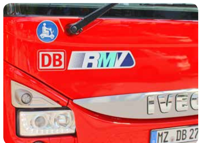
RMV-Logo mit Piktogrammen an Fahrzeugfront (Beispiele)