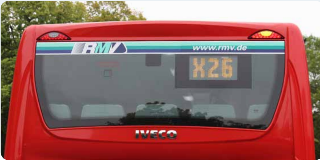
RMV-Bänderole am Dachrand (Beispiele)