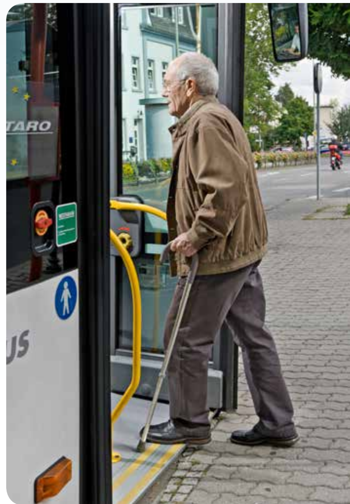
Bus im Kneeling-Prozess (Beispiel)

Fahrzeuge in Niederflurbauweise verfügen über eine Absenkvorrichtung (Kneeling) als elektronisch-pneumatisches System an der Einstiegsseite. Hierbei muss das Fahrzeug (gemäß ECE-R 107 und 2001/85/EG) so weit abgesenkt werden können, dass eine Einstiegs- höhe entweder an einer Tür von 250 Millimetern oder an zwei Türen von jeweils 270 Millimetern erreicht wird. Die Absenkung darf nur bei Fahrzeugstillstand beziehungsweise bei einer Geschwindigkeit von bis zu drei Stundenkilometern erfolgen. Gleichzeitig muss die Anfahrsperrung aktiviert sein.