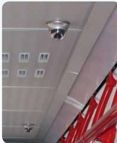
Tag- und Nachtkameras (Beispiel)

Zur Erhöhung der subjektiven und objektiven Sicherheit der Fahrgäste sind die Regelfahrzeuge mit einem Videoaufzeichnungssystem ausgestattet. Im Fahrzeuginnenraum sind hierzu vandalismusresistente Tag- / Nachtkameras angebracht. Diese sind so verteilt, dass der gesamte Fahrgastraum, insbesondere die Türbereiche überwacht werden und eine Gesichtserkennung möglich ist. Dafür sind im Solobus mindestens vier und im Gelenkbus mindestens sechs Kameras erforderlich. Die Speicherkapazität ist auf mindestens 72 Stunden Aufzeichnungsdauer ausgelegt. Beim Fahrpersonal ist ein Alarmtaster angebracht, der bei Betätigung die aufgezeichneten Videodaten gegen Überschreiben sichert. Zusätzlich ist im Bereich der Fahrerkabine ein Kontrollmonitor installiert. Die Fahrgäste werden in geeigneter Weise, zum Beispiel durch Aufkleber, auf die Videoaufzeichnung, gemäß den Anforderungen der Datenschutzgrundverordnung (DSGVO), hingewiesen.