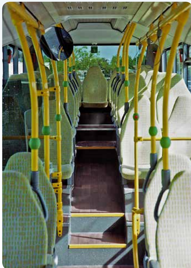
Low-Entry-Bus, niederfluriger vorderer Bereich, hochfluriger Heckbereich (Beispiel)

Grundsätzlich sind die eingesetzten Fahrzeuge, sowohl im städtischen als auch im Überlandverkehr, niederflurig und erfüllen damit die Anforderungen an die Barrierefreiheit. Sie sind mindestens zweitürig und verfügen über einen podestlosen Boden (stufenloser Mittelgang) zwischen der ersten und zweiten Tür. Nur in Ausnahmefällen (zum Beispiel aufgrund topographischer Gegebenheiten) kommen hochflurige Fahrzeuge mit einer Fußbodenhöhe bis 860 Millimeter zum Einsatz. Eine weitere Möglichkeit ist der Einsatz sogenannter Low-Entry-Busse, die einen niederflurigen Bereich zwischen Tür 1 und Tür 2 aufweisen. Der Heckbereich ist jedoch hochflurig und nur über Stufen im Mittelgang erreichbar.