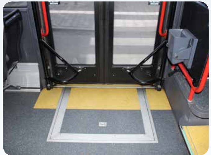
eingeklappte Rampe (Beispiel)

Die Haltewunschtasten sind innen an den Haltestangen (von jeder zweiten Sitzreihe aus erreichbar), an der Fahrerkabine rückseite sowie im Bereich der Sondernutzungsfläche vorzusehen.