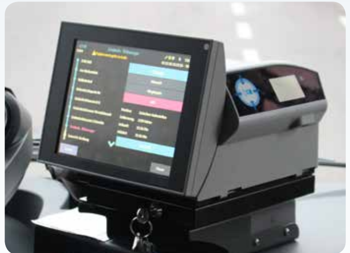
Busdrucker einschließlich eTicket-Lesegerät (Beispiel)

Im Zuge der geplanten Einführung des elektronischen Fahrgeldmanagements ( EFM ) in der Ausbauvariante 3 der VDV-Kernapplikation muss sichergestellt werden, dass die Fahrzeuge für die Realisierung eines Raum-erfassungssystems (automatische Erfassung von Fahr-karten, Be-In/Be-Out-Verfahren) vorbereitet sind.