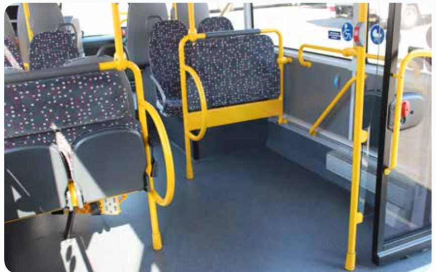
Sondernutzungsflächen Tür 2 (Beispiele)