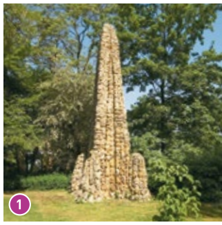
Obelisk: Der pittoreske, mit Muschelkalk verkleidete Obelisk aus der Entstehungszeit des Parks gehört zu den ältesten Bauwerken.