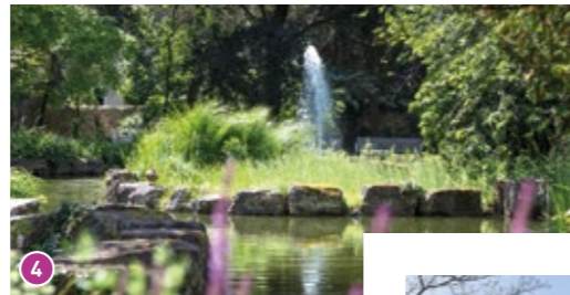
Teich: Der künstliche Teich mit Wasserfontäne ist ein Blickfang und beherbergt unter anderem zahlreiche Fische und Schildkröten.

Informationen zum Verna-Park, zu Führungen und Veranstaltungen sowie zu weiteren Sehenswürdigkeiten in Rüsselsheim am Main finden Sie auf unserem Kultur- und Freizeitportal www.main-ruesselsheim.de .