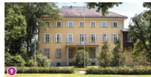
Palais Verna: Das Palais Verna liegt am Parkeingang Ludwig-Dörfler-Allee und wird von der Stadtverwaltung als Bürogebäude genutzt.