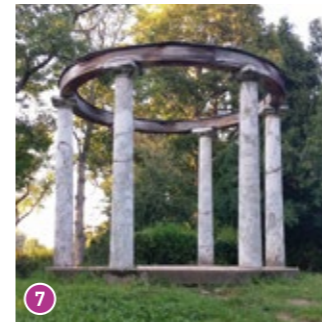
Monopteros: Im Urzustand erweckten die umgestürzten Säulen des Monopteros künstlich den Eindruck des Verfalls, um an den verstorbenen Freiherrn von Verna zu erinnern.