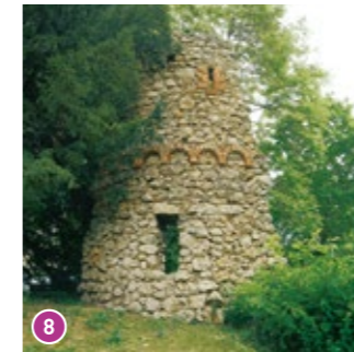
Grotte: In den Sechzigern mussten Teile der Grotte aus Sicherheitsgründen zugeschüttet werden. Heute noch zu erkennen: Schießscharten und ein gotisches Fenster.