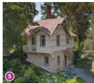
Alte Mühle (Eremitage): In dem denkmalgeschützten Fachwerkbauwerk wurde ein Trauzimmer eingerichtet und es bietet eine wunderschöne Kulisse für Brautpaare.