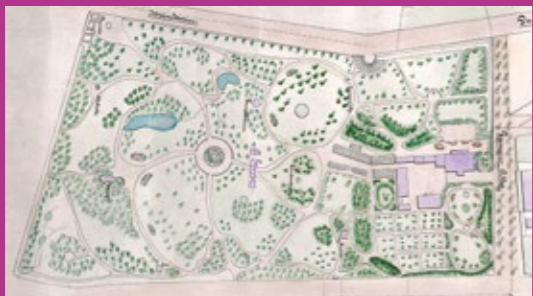
Historischer Plan des Verna-Parks.

schon damals an die örtliche Bebauung an und war deshalb von Anfang an ringsum durch eine Mauer geschützt – eine echte Besonderheit. Die Freifrau war wohl auch recht stolz auf ihr Lebenswerk, denn zweimal im Jahr öffnete sie ihren Privatpark für die Bevölkerung. Seitdem der herrschaftliche Garten 1911 in öffentliches Eigentum übergegangen ist, können Einheimische und Gäste jederzeit an seiner Schönheit teilhaben.