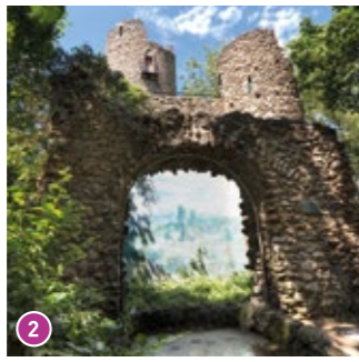
Turm mit Trompe-l'oeil-Malerei: Die Illusionsmalerei an der künstlichen Ruine täuscht den Blick in endlose Weiten vor.