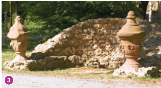
Nische: Die Nische aus Muschelkalk mit zwei großen Sandsteinvasen ist original und befindet sich noch am ursprünglichen Standort.