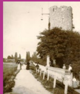
Historische Aufnahme der Ruine vom Maindamm aus.