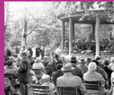
Sonntagskonzert im Pavillon Anfang der 60er Jahre.