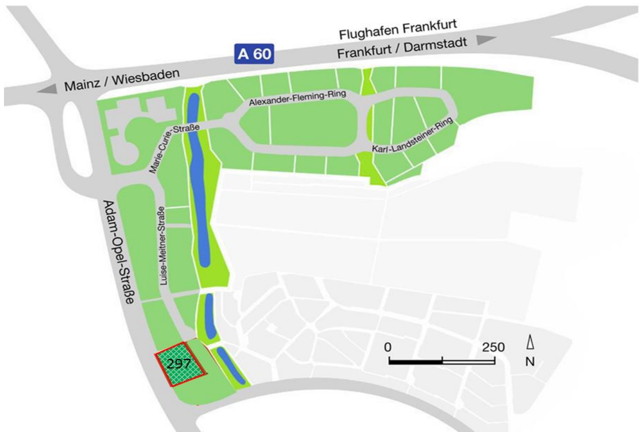
Lageplan des Grundstücks